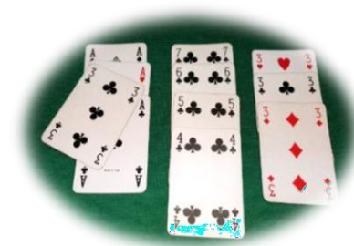
Carta errata: da scartare

Se il lancio del nuovo gioco o quello delle carte legate costituiscono l'ultimo gioco effettuato prima della chiusura, questa è valida e l'arbitro ammonirà la coppia colpevole.