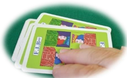
Ispezione del tallone

Quando nel tallone rimangono poche carte, il solo giocatore di turno ha facoltà di ispezionarlo muovendo le carte che lo compongono senza cambiarne l'ordine e senza alzarle; se il tallone viene ispezionato da un giocatore non di turno sarà considerato un illecito suggerimento e quindi sarà l'avversario di turno a decidere l'azione di pesca o raccolta (se ci sono le premesse) che dovrà effettuare il giocatore che ha ricevuto il suggerimento.