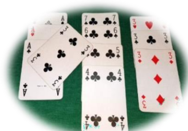
Carta valida da accorparsi al gioco naturale