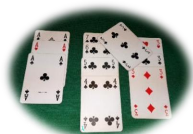
Palese dubbio: se non dichiarata, decide il primo avversario di turno

dichiarazione e questa o queste non toccano i giochi esistenti saranno considerate valide, ma congeleranno temporaneamente il gioco; se invece toccano due giochi o non toccano nessun gioco e creano palese dubbio, sarà l'avversario di turno a decidere la loro collocazione; se cadono su un gioco che non le può contenere saranno considerate penalizzate (art. 24) e scartate secondo norma.