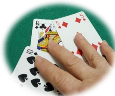
Ispezione del monte degli scarti

parzialmente il dorso di una carta sarà obbligato alla raccolta.