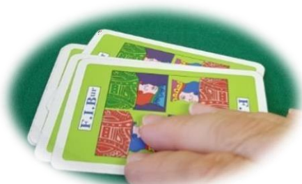
Ispezione del tallone

Quando nel tallone rimangono poche carte, il solo giocatore di turno ha facoltà di ispezionarlo muovendo le carte che lo compongono senza cambiarne l'ordine e senza alzarle; se il tallone viene ispezionato da un giocatore non di turno sarà considerato un illecito suggerimento e quindi sarà l'avversario di turno a decidere l'azione di pesca o raccolta che dovrà effettuare il giocatore che ha ricevuto il suggerimento.