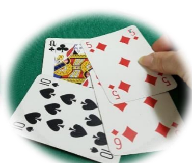
Raccolta dal monte degli scarti