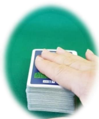
Carta non pescata