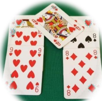
carta valida da accorparsi al gioco naturale