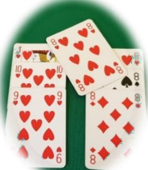
palese dubbio : se non dichiarata decide il primo avversario di turno

Nel caso in cui un giocatore lega una o più carte con il lancio l'arbitro interromperà il gioco e ammonirà la coppia colpevole (se non vi è stata una chiara dichiarazione e questa o queste non toccano i giochi esistenti saranno considerate valide, ma congeleranno temporaneamente il gioco; se invece toccano due giochi o non toccano nessun gioco e creano palese dubbio sarà l'avversario di turno a decidere la loro collocazione; se cadono su un gioco che non le può contenere saranno considerate penalizzate (Art.25) e scartate secondo norma).