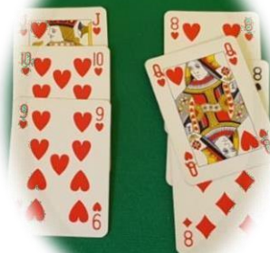
carta errata: da scartare

Se il lancio del nuovo gioco o quello delle carte legate costituisce l'ultimo gioco effettuato prima della chiusura, questa è valida e l'arbitro ammonirà la coppia colpevole.